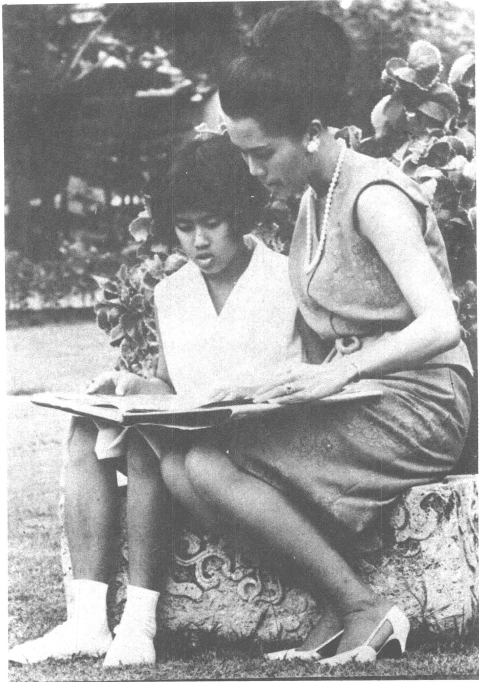
... ทรงเรียนได้ทุกอย่าง โปรดภาษาไทย ไม่โปรดภาษาอังกฤษ แต่มีพรสวรรค์...